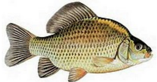
Carassin 20 à 50 cm