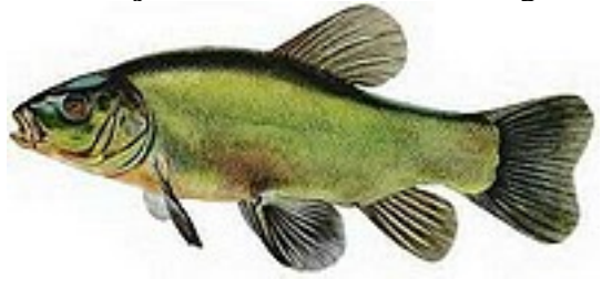
Tanche 20 à 65cm - 200/400g à 4 kg / TMC 15cm