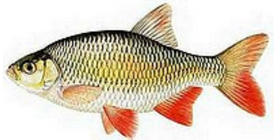
Rotengle 15 à 45 cm - 300g à 1,8 kg