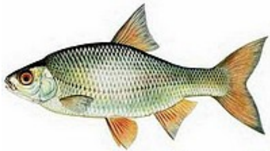
Gardon 15 à 45 cm - 200g à 2,4 kg / TMC : 10cm