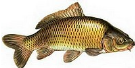
Carpe 25 à 100 cm - jusqu'à 27kg / NoKill