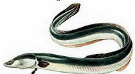
Anguille 40 cm à 150 cm, jusqu'à 4 kg

http://www.wambrechies-peche.com TMC : Taille Minimale de Capture