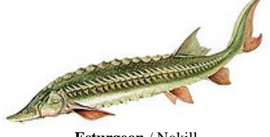
Esturgeon / Nokill