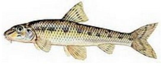
Goujon 10 à 25 cm - max. 175g