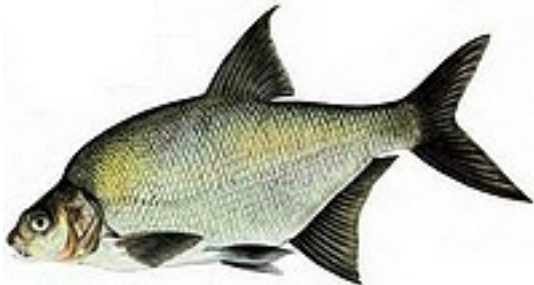
Brème 30/40 cm - 0,5 à 2 kg