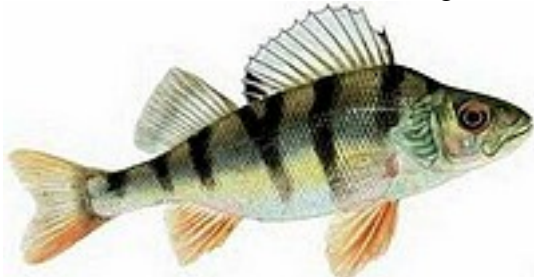
Perche 20 à 50cm - 200/300g à 4,8 kg